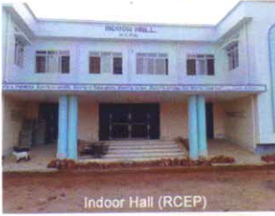
Indoor Hall (RCPE)

বর্তমানে আঞ্চলিক শারীর শিক্ষণ মহাবিদ্যালয়ের একাডেমিক ভবন, ত্রিপুরা স্পোর্টস স্কুল, ২০০ আসন বিশিষ্ট ছাত্রী এবং মহিলা আবাস ও ইনডোর হল গড়ে উঠেছে।