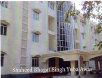
Shaheed Bhagat Singh Yuba Awas

বর্তমানে ত্রিপুরা রাজ্যে মোট ছোট ও বড় মিলিয়ে ৭৮৫টি খেলার মাঠ, দশরথদেব স্টেডিয়াম, এম বি বি স্টেডিয়াম এবং ৪৬টি মিনি স্টেডিয়াম রয়েছে। এছাড়াও রয়েছে ৮টি স্পোর্টস হল, ৩টি জিমন্যাসিয়াম, ৭টি সাঁতারের প্ল্যাটফর্ম এবং ২টি বিজ্ঞান ভিত্তিক পুল, যুব আবাস, ইন্ডোর স্টেডিয়াম, স্টেট এ্যাডভেঞ্চর ইনস্টিটিউট, আঞ্চলিক শারীরশিক্ষা প্রশিক্ষণ কেন্দ্র এবং স্পোর্টস স্কুল ২টি(বাধারঘাট ও পানিসাগর)।