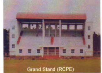
Grand Stand (RCPE)