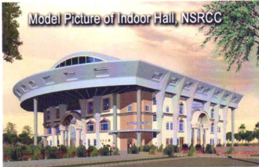
Model Picture of Indoor Hall, NSRCC