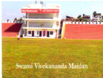
Swami Vivekananda Maidan