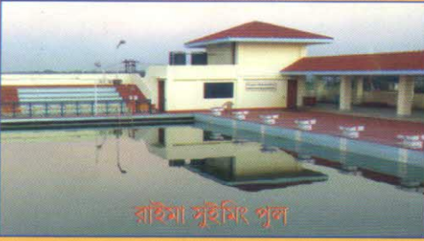
রাইমা সুইমিং পুল

মানব সম্পদ উন্নয়নের ক্ষেত্রে খেলাধুলা একটি বিশেষ ভূমিকা পালন করে। খেলাধুলার পরিকাঠামো উন্নয়নের জন্য রাজ্য যুব বিষয়ক ক্রীড়া দপ্তর বিশেষ ধারাবাহিক প্রচেষ্টা চালিয়ে আসছে। যেমন, বাধারঘাটের দশরথ দেব স্টেট স্পোর্টস কমপ্লেক্স, যেখানে থাকবে ৪০০ (চারশত) মিটার জায়গা জুড়ে আধুনিক সিঙ্গেলটিক অ্যাথলেটিক্স ট্রেক, ফুটবল স্টেডিয়াম যাতে থাকবে আধুনিক ও আন্তর্জাতিক মানের ৩০ (ত্রিশ) হাজার দর্শক আসন বিশিষ্ট গ্যালারি। হকি খেলার জন্য মাঠ, ৩০০ (তিনশত) শয্যা বিশিষ্ট ক্রীড়া আবাসন, ১০০ (একশত) আসন বিশিষ্ট স্পোর্টস কনফারেন্স হল। ত্রিপুরা স্পোর্টস স্কুল যেখানে রয়েছে ছাত্র ও ছাত্রীদের জন্য আলাদা বোর্ডিং হোস্টেল। সাঁতারের মান উন্নয়নের জন্য রয়েছে আধুনিক ও সুসজ্জিত রাইমা সুইমিং পুল। যেখানে আছে কভারড শেড বিশিষ্ট গ্যালারি, অত্যাধুনিক বৈদ্যুতিক ব্যবস্থাপনা, কার পার্কিং প্লেস, কোচদের জন্য রুম, প্লেয়ার্স রুম এবং বিশ্রামাগার।