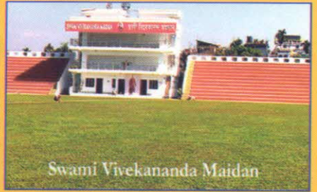
Swami Vivekananda Maidan

অত্যাধুনিক ভাবে তৈরি করা হচ্ছে ঐতিহ্যবাহী 'নেতাজি সুভাষ আঞ্চলিক প্রশিক্ষণ কেন্দ্র' (এন এস আর সি সি), যেখানে থাকবে ২০০০ (দুই হাজার) আসন বিশিষ্ট আধুনিক জিমন্যাসিয়াম হল, যোগা, ব্যাডমিন্টন, জুডো, ওয়েটলিফটিং এর জন্য শীততাপ নিয়ন্ত্রিত বহুতল বিশিষ্ট হল ঘর। তাছাড়া রয়েছে আধুনিক বিজ্ঞান সম্মত সাঁতার প্রশিক্ষণের জন্য সুইমিং পুল এবং নিরাপত্তার বিশেষ ব্যবস্থা।