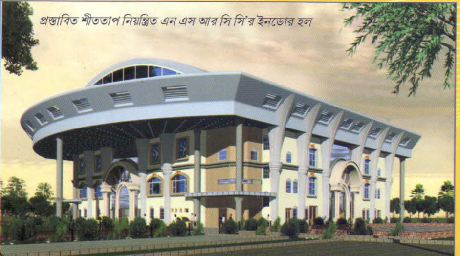
প্রস্তাবিত শীততাপ নিয়ন্ত্রিত এন এস আর সি সি'র ইনডোর হল

তৈরি করা হয়েছে ৩০০ (তিনশত) আসন বিশিষ্ট শহিদ ভগৎ সিং যুব আবাস।। যেখানে রয়েছে সব ধরনের আধুনিক সুব্যবস্থা।