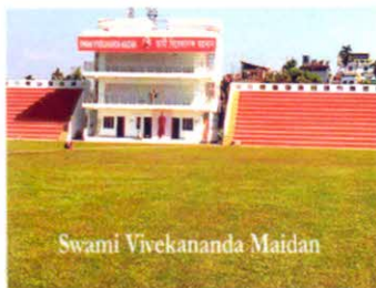
Swami Vivekananda Maidan