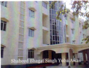
Shaheed Bhagat Singh Yuba Awas

বর্তমানে ত্রিপুরা রাজ্যে মোট ছোট ও বড় মিলিয়ে ৭৮৫টি খেলার মাঠ, দশরথদেব স্টেডিয়াম, এম বি বি স্টেডিয়াম এবং ৪৬টি মিনি স্টেডিয়াম রয়েছে। এছাড়াও রয়েছে ৮টি স্পোর্টস হল, ৩টি জিমন্যাসিয়াম, ৭টি সাঁতারের প্ল্যাটফর্ম এবং ২টি বিজ্ঞান ভিত্তিক পুল, যুব আবাস, ইন্ডোর স্টেডিয়াম, স্টেট এ্যাডভেঞ্চার ইনস্টিটিউট, আঞ্চলিক শারীরশিক্ষা প্রশিক্ষণ কেন্দ্র এবং স্পোর্টস স্কুল ২টি(বাধারঘাট ও পানিসাগর)।