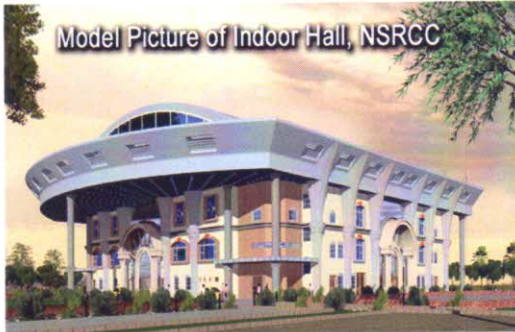
Model Picture of Indoor Hall, NSRCC